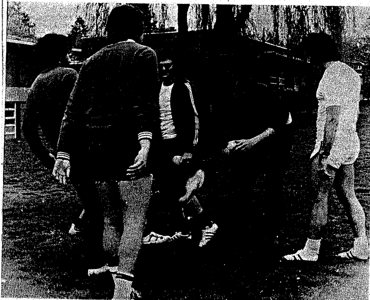
Ce ne sont pas les "Whitecaps" mais des gars qui sont bien intéressés par le soccer. Vous pouvez les voir tous les dimanches à 14 heures au Parc Douglas, au coin d'Heather et de la 20 e avenue. Lisez la page 15 et vous découvrirez ce qu'ils sont -